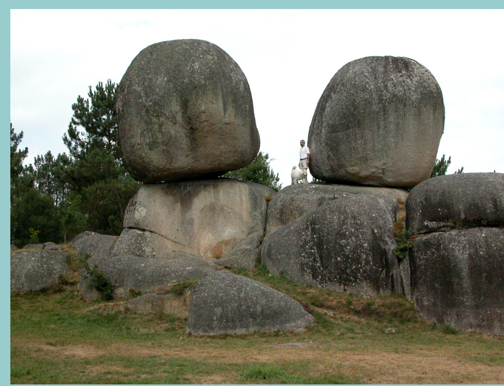
Penedos das Rodas (nas proximidades de Rábade - Lugo), contan que unha ten ouro e a outra xofre. Non se poden romper porque non se sabe cal é a do ouro e xofre extenderíase queimando todo.