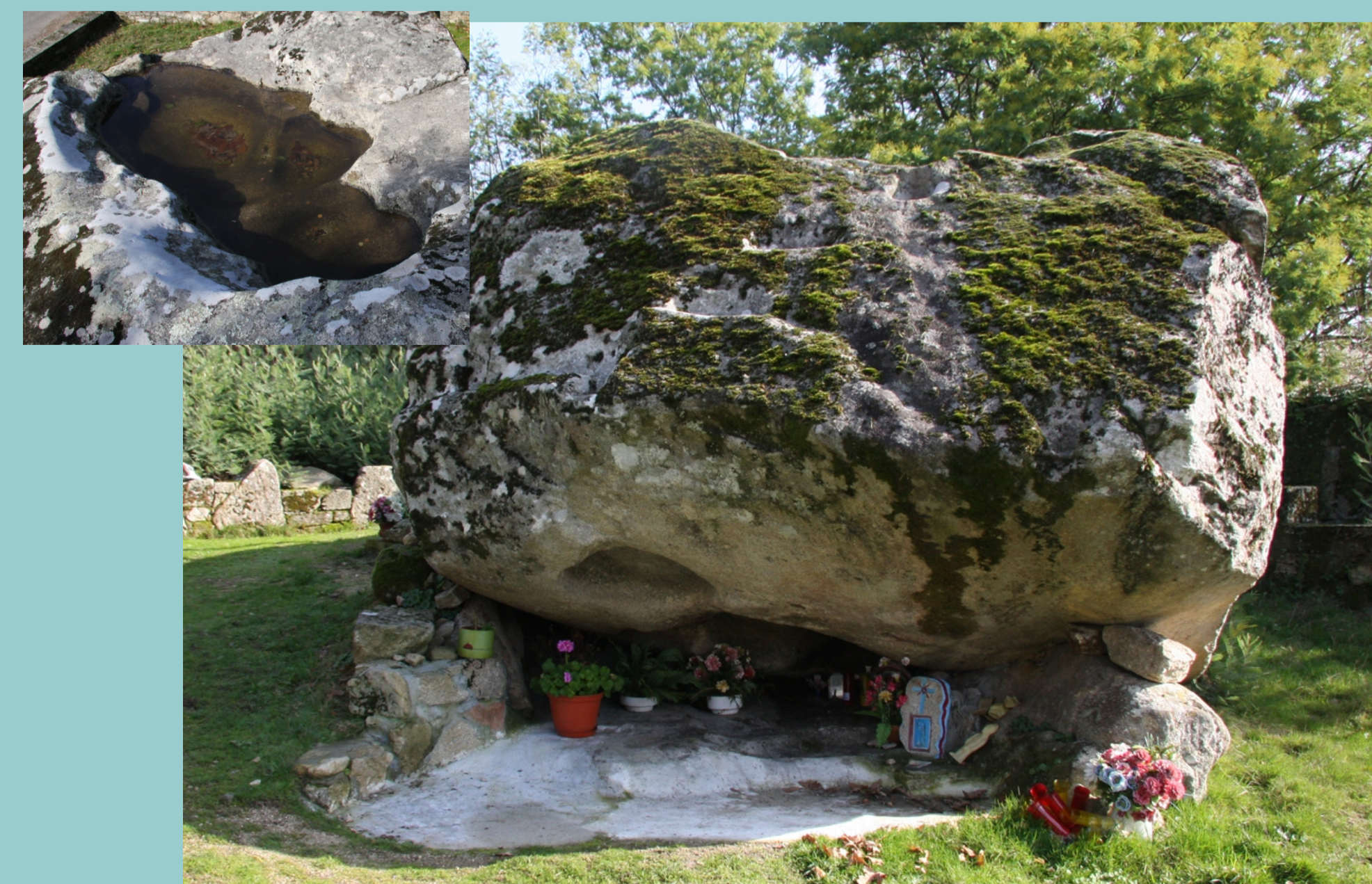
Penadauga, nas proximidades da igrexa de Santa Sabela de Escuadro. Un santuario de tradición moi antiga. A xente acode a curar distintos males (especialmente as espullas) coa auga que se acumula no alto da pedra, nunha gran pia natural, e vai esbarando polo seu interior.