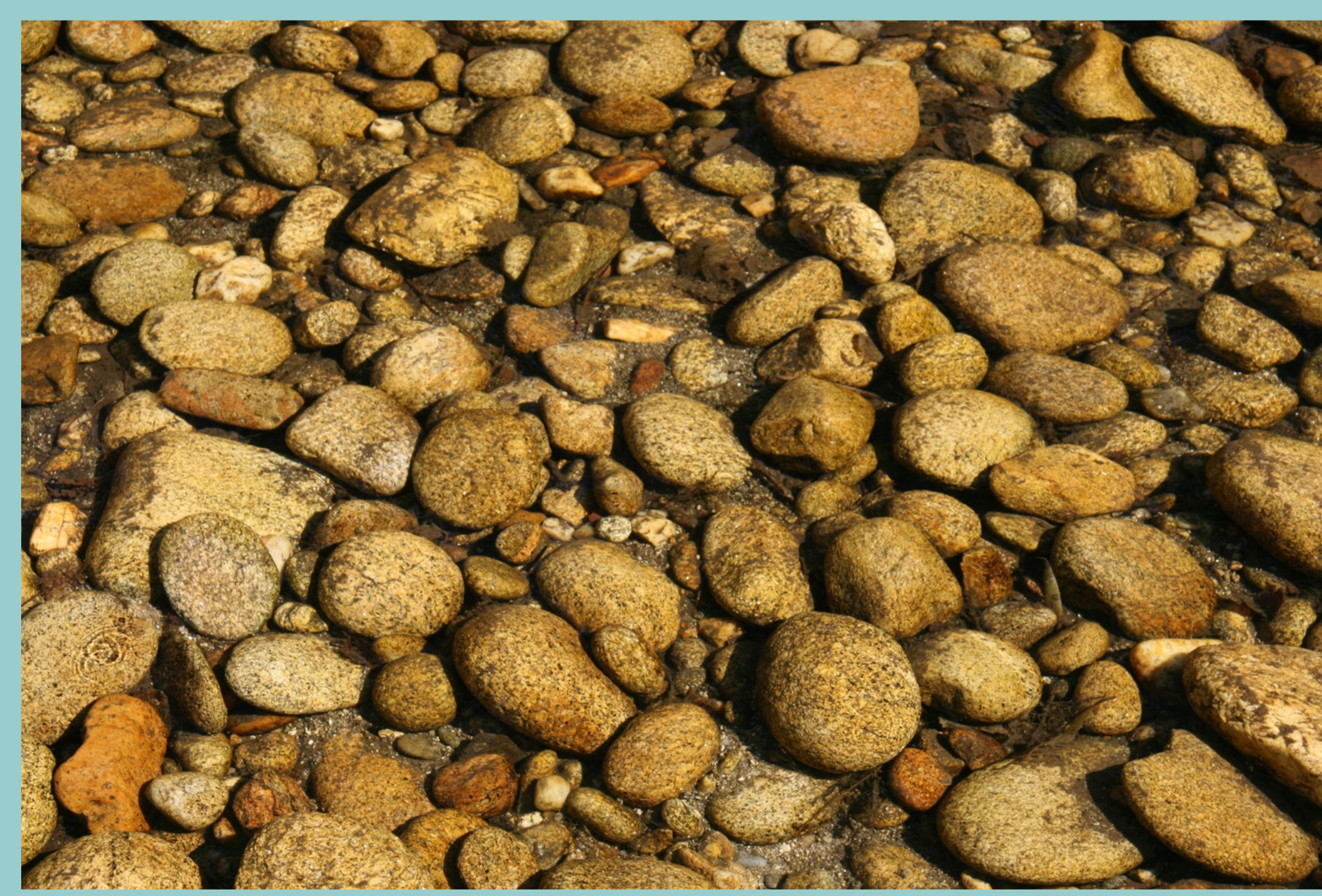
Coios, pelouros... no río Tea

Desde moi antigo as pedras con formas curiosas, en difícil equilibrio ou con ocos, e aquelas nas que se formaban pías e cacholas que retiñan auga, deron lugar a gran cantidade de lendas e ritos relacionados co amor, a fecundidade ou a curación de diversas enfermidades físicas ou psíquicas.