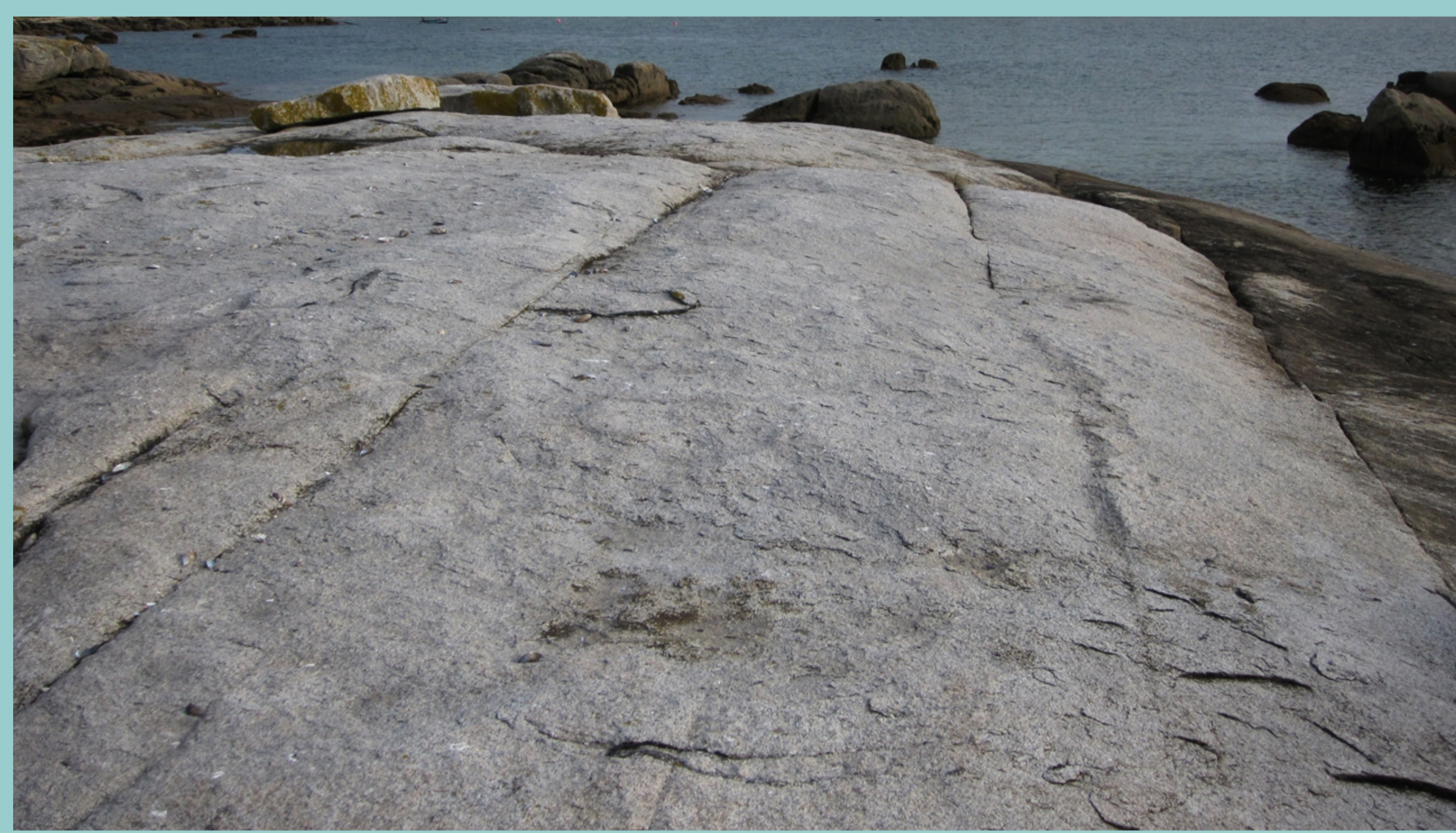
Laxes na Illa de Arousa