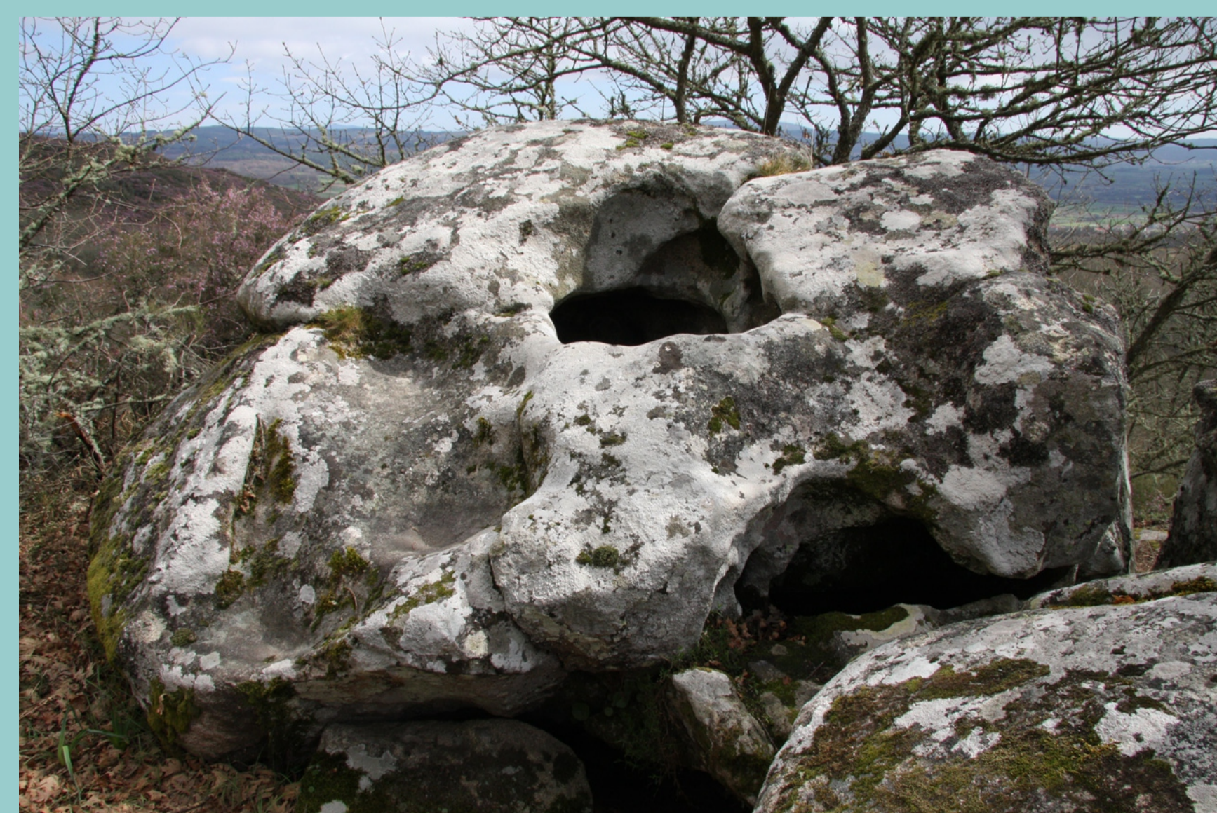
Pedra do Arangaño, en Perrelos (Sarreaus). Segundo a tradición os nenos entarangañados facíanse pasar polo burato da pedra para que curasen.

Á súa orixe natural atribúeselle moitas veces carácter máxico relacionado cos mouros ou con santos. Hai penas para curar o tangaño, as dores dos ósos, os males da cabeza... Outros penedos teñen poderes maléficos e neles nacen os malos ventos ou viven seres malignos.